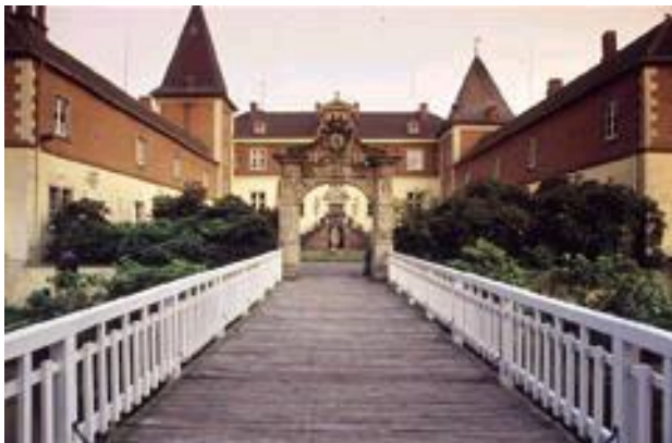
Ferienzentrum Schloß Dankern mit Dankernsee